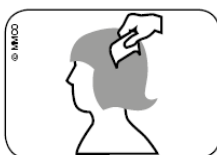
Abb. Durchkämmen des nassen Haares mit Läusekamm vom Haaransatz bis zu den Haarspitzen